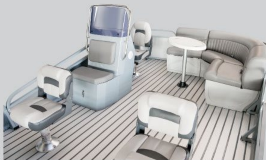
Просторий кокпіт з індивідуальними сидіннями та майданчиком для риболовлі, зоною відпочинку зі з'ємним столиком