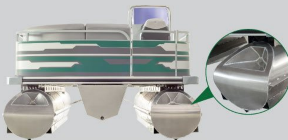
Балони катера виготовлені з алюмінієвого сплаву EN AW5083-H111 (Норвегія). На кормових балонах зручні сходинок