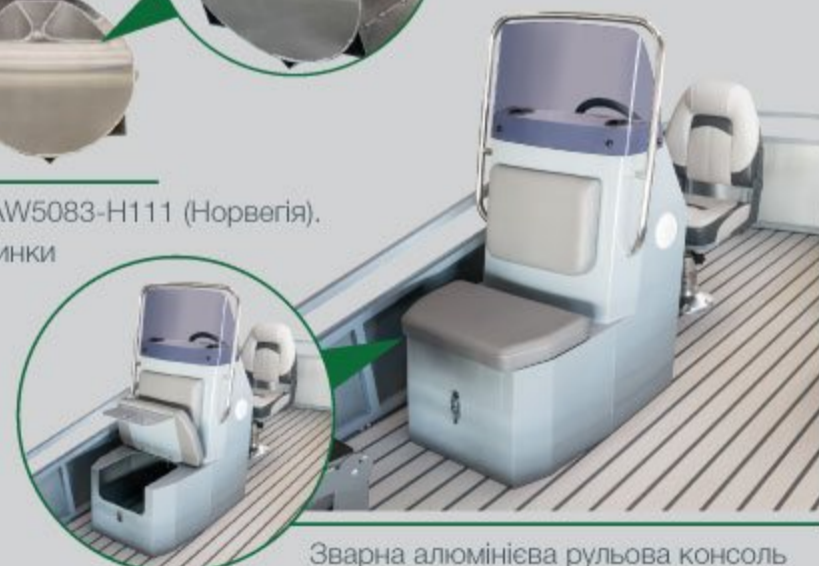
Зварна алюмінієва рульова консоль з додатковим сидінням та рундуком